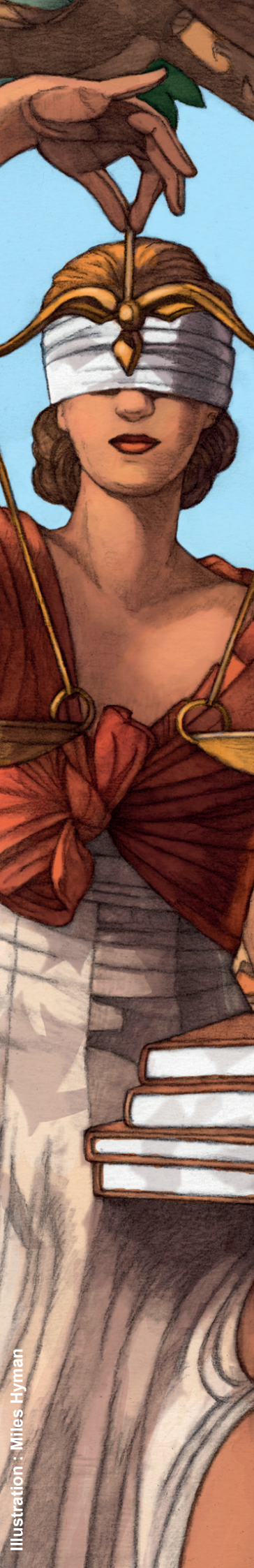
Illustration : Miles Hyman

Centre pour les humanités numériques et l'histoire de la justice CNRS - UAR 3726