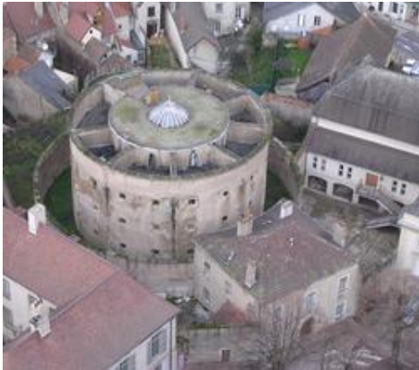
Maison d'arrêt d'Autun.

Le projet se poursuit avec des mises en ligne régulières de nouveaux lieux de justice. Un